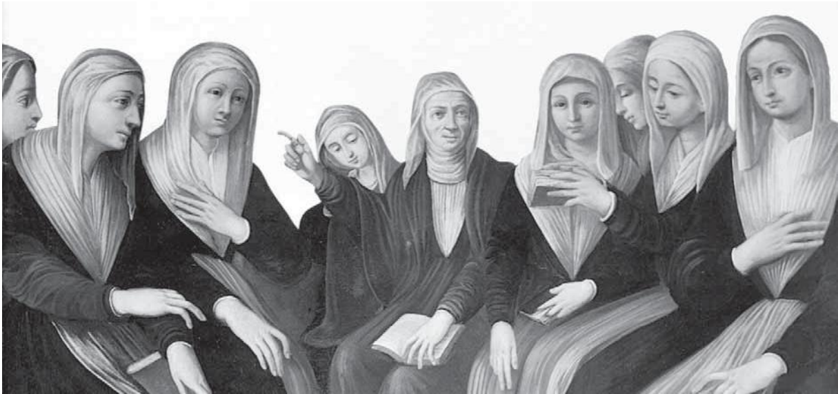
Afb. 74 Angela Merici temidden van haar eerste gezellinnen, door onbekende schilder.

maagdelijkheid beloofden, een alternatief voor het huwelijk als dé levensvorm voor vrouwen.